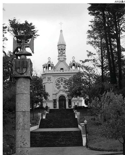
Parque de La Salette é um dos espaços a visitar

Os jovens interessados em participar devem inscrever-se até dia 6, na Loja Ponto Ponto Já, situada na Avenida Ferreira de Castro. A inscrição determina a participação na totalidade do projecto. Outras informações podem ser solicitadas através do email juventude@cm-oaz.pt ou pelo telefone 256 065 587. ◀